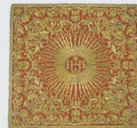
Véu de cálice Inv. MT. 107

Filippo Salandri (bordador), Francesco Giuliani (alfaiate) Itália, Roma, 1744- 1749 Gros de tours laminado a fio de prata dourada, bordado a ouro, tafetá, fios de ouro e renda de bilros em fios dourados Inv. MT. 22, 26, 27, 29, 38, 107 e 148