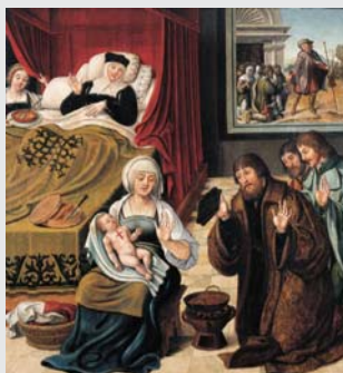
Natividade e adolescência de São Roque Inv. Pin. 52

Jorge Leal/ Cristóvão de Utreque (?) Portugal, c. 1520 Óleo sobre madeira Inv. Pin. 52, 53, 55 e 56