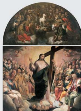
Adoração do Cordeiro Místico pela Corte Celestial e Cristo em Glória rodeado dos Santos Mártires Inv. Pin. 198 e 217

Fernão Gomes Virgem em Glória rodeada das Santas Mártires Diogo Teixeira Portugal, c. 1590-1600 Óleo sobre tela Inv. Pin. 217 e 214